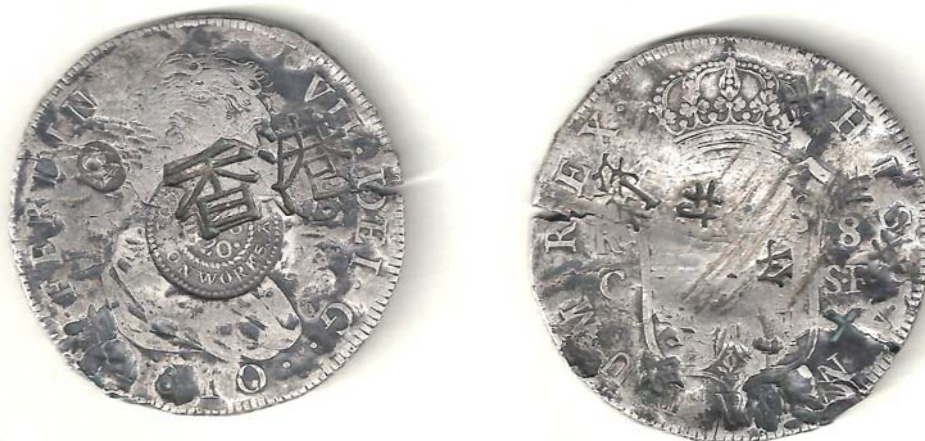
Fig. 1.- Anv. y Rev. de 8 Rles Fernando VII 1810 C. SF

Los viajes de una moneda (8Rles Fernando VII 1810 C. SF)